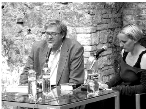
Pál Závada, maďarský spisovateľ slovenského pôvodu